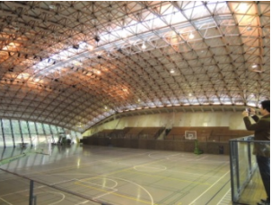
1988年（S63）に完成した小国ドームは小国杉を使った大型建築物の草分け的建物です