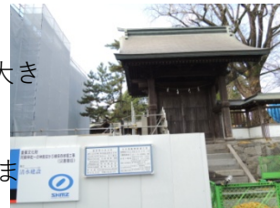
2016年（H28）4月14日の熊本地震で大きな被害を受けた肥後国一の宮阿蘇神社です。10年掛かると言われる復旧作業が行われています。