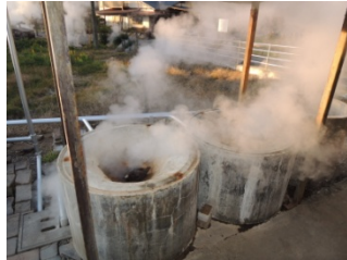
小国町は「地熱とバイオマスを活かした農林業タウン構想」を発表しました。山間部では、盛んに蒸気を吹き上げる地区があります。この恵みを利用して木材乾燥や煮物にも利用しています。究極のエコ！