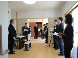
熊本空港近くに復興住宅モデル棟が建っています。地域の気候や生活習慣を取り入れたプランに人気があるようです。

熊本県小国町は2014年に環境モデル都市に採択され「地熱とバイオマスを活かした農林業タウン構想」を発表